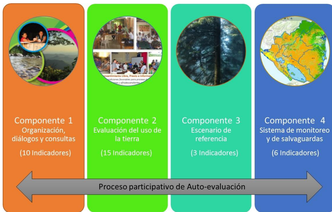
Figura 3. Esquema del proceso participativo de Auto-evaluación que incluye la evaluación por parte de los protagonistas acerca de los avances en los cuatro componentes de ENDE-REDD+.

La Auto-evaluación de la preparación de país en Nicaragua se realizará mediante sesiones de trabajo tanto a nivel central (Managua), como en las Regiones Autónomas del Caribe Norte y Sur, en Bilwi y Bluefields respectivamente. En estas sesiones de Auto-evaluación se aplicará una guía metodológica, la cual incluirá indicadores para medir el avance y una valoración (cualitativa y cuantitativa) que permitirá asegurar una adecuada comprensión del progreso versus los indicadores, de este modo se logrará obtener la valoración de cada grupo de protagonistas en los avances reportados.